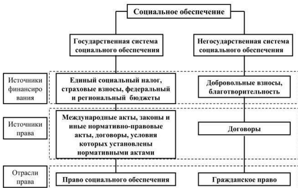
Рисунок 1 – система социального обеспечения

При необходимости иллюстрации могут иметь наименование и пояснительные данные (подрисовочный текст). В таком случае слово «рисунок» и его номер помещают после пояснительных данных. При ссылках на иллюстрации следует писать «... на рисунке 1 показаны результаты деятельности федеральных судов общей юрисдикции и мировых судей в 2018 и 2019 годах...» и т.п.